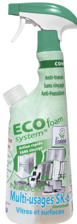
VITRES ET SURFACES